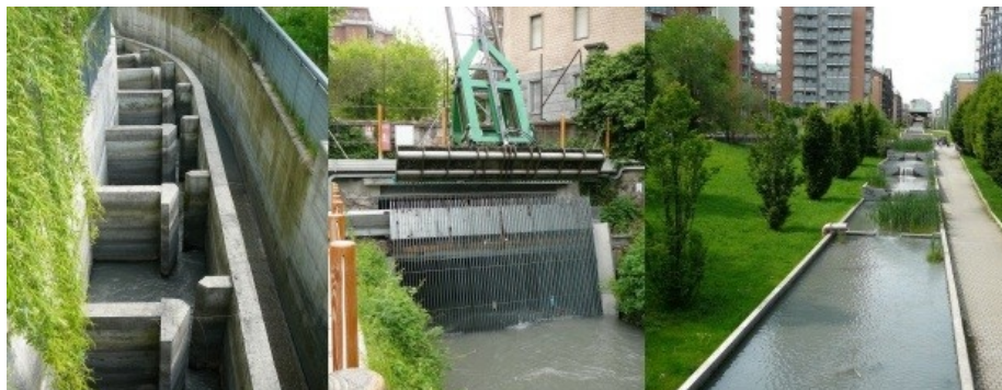
Fot. 3. Przepławka usytuowana na początku kanału obiegowego, urządzenie wychwytyjące nieczystości z wód kanału oraz końcowy odcinek kanału w formie kaskadowej.

turbinę Kaplana o mocy 670 kW (Fot. 2.). Efektywna moc turbiny wynosi około 434 kW, a średnia roczna produkcja energii 3 800 000 kWh. Hydroelektrownia codziennie dostarcza zielonej energii dla obiektów EnviParku, zaopatruje biura 70 firm o szacunkowej powierzchni 45 000 m 2 .