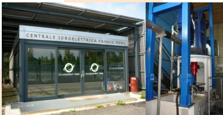
Fot. 2. Budynek hydroelektrowni w Environment Parku w Turynie, turbina Kaplana.

W pobliżu EnviParku płynie Dora Riparia (Fot. 1). Źródła rzeki znajdują się na północnych stokach Alp Kocyjskich, w pobliżu przełęczy Montgenčvre, w dalszym biegu przepływa ona przez nizinę Piemontu, w pobliżu Turynu uchodzi do Padu. Wody Dory wykorzystywane są gospodarczo (nawodnienia) oraz do produkcji energii elektrycznej. Obecność cieku wykorzystano w strefie „Green Building” propagującej ekologiczne rozwiązania w budownictwie. Zaprojektowano i wybudowano tu elektrownię wodną, która została uruchomiona w lipcu 2008 roku (Fot. 2.).