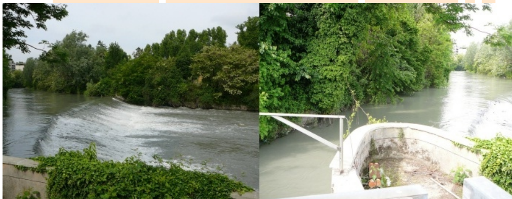
Fot. 1. Rzeka Dora Riparia oraz początkowy odcinek kanału obiegowego.

We Włoszech często korzysta się z rozwiązania uwzględniającego kanał obiegowy, czego doskonałym przykładem jest mała elektrownia wodna należąca do parku technologicznego w Turynie. W dzisiejszych czasach coraz częściej staramy się łączyć osiągnięcia nauki z sektorem gospodarki. Wdrażamy nowe, przyjazne środowisku technologie. Budowę Environment Parku (EnviParku) rozpoczęto w 1996 roku z inicjatywy Regionu Piemont oraz miasta Turyn przy wsparciu Unii Europejskiej. Powierzchnię 30 000 m 2 pokrywają obecnie laboratoria, biura i centra serwisowe. Główne cele jednostki to działania w myśl zrównoważonego rozwoju - propagowanie budownictwa zeroenergetycznego, odnawialnych źródeł energii, ogólne zmniejszanie zużycia energii, oraz wdrażanie wszelkich innowacji technologicznych przyjaznych środowisku.