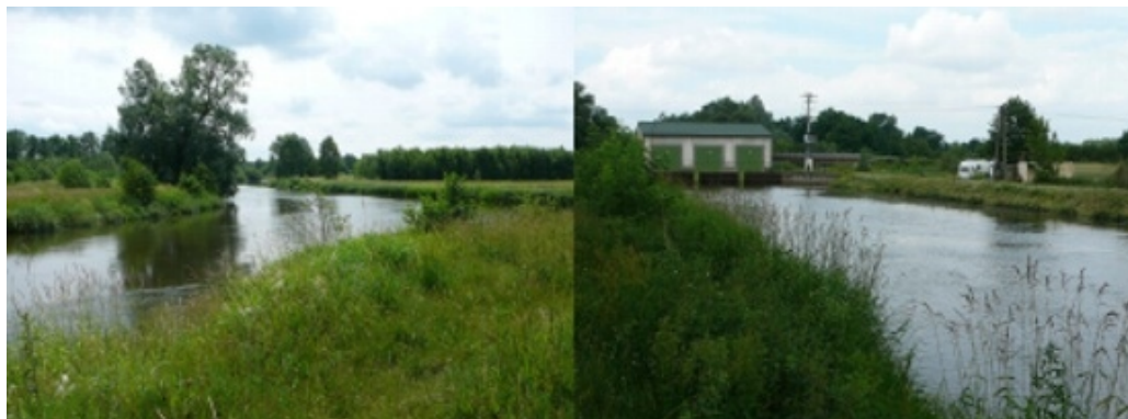
Fot. 5. Rzeka Widawka na wysokości początkowego odcinka kanału obiegowego oraz budynek hydroelektrowni „Podgórze” na kanale obiegowym.

są wykorzystywane z uwagi na to, że przepływy w Widawce są zazwyczaj niskie. Rzadko zdarza się żeby w tym samym czasie uruchomione były 3 turbiny, najczęściej pracuje jedna.