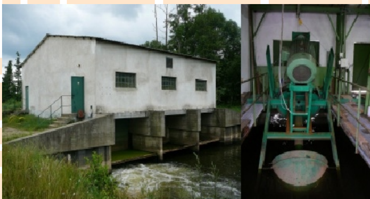
Fot. 4. Budynek hydroelektrowni „Pogórze” oraz jedna z turbin Kaplana.

Przykładem technicznego rozwiązania, stosowanego do niwelowania niekorzystnego wpływu hydroelektrowni na ekosystem jest MEW "Pogórze" w gminie Widawa, powiecie łaskim, gdzie zastosowano konstrukcję na kanale obiegowym. Wybudowana w 2004 roku hydroelektrownia składa się z budynku z siłownią (Fot. 4.), wyposażoną w 3 turbiny Kaplana (Fot. 4.) o łącznej mocy 165 kW, oraz kanału o długości 350 m, którego zadaniem jest doprowadzanie spiętrzonej wody do elektrowni, a następnie odprowadzanie wody z turbin. Budowa kanału (Fot. 5) obejmowała nie tylko jego wykopanie, ale także uszczelnienie geotkaniną, faszyną i umocnienie kołkami. Użytkowanie kanału wiąże się także z jego konserwacją, która ma na celu przeciwdziałanie zarastaniu.